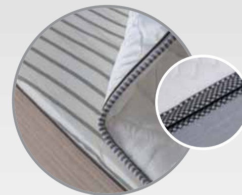
Bordato sfoderabile con cerniera a scomparsa: H. interna 22 cm - H. esterna 25 cm