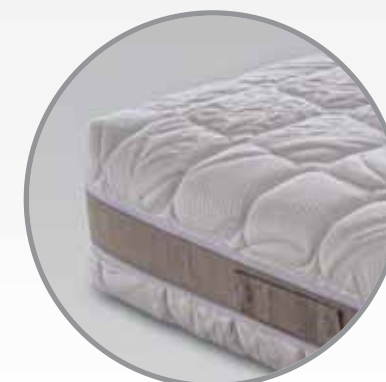
Sfoderabile: H. interna 22 cm - H. esterna 25 cm