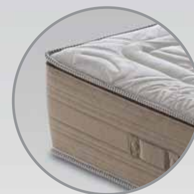
Bordato: H. interna 22 cm - H. esterna 25 cm